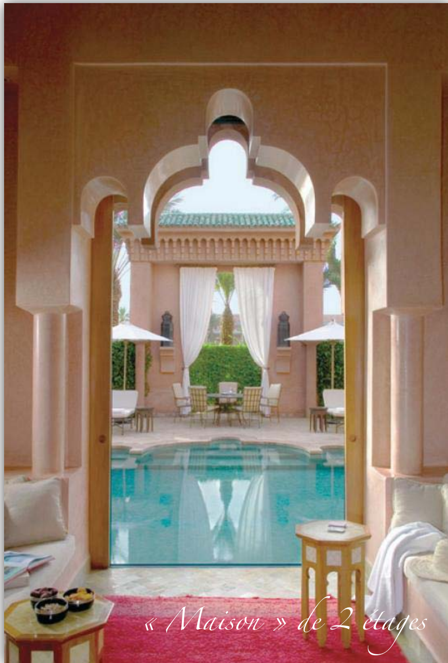
« Maison » de 2 étages