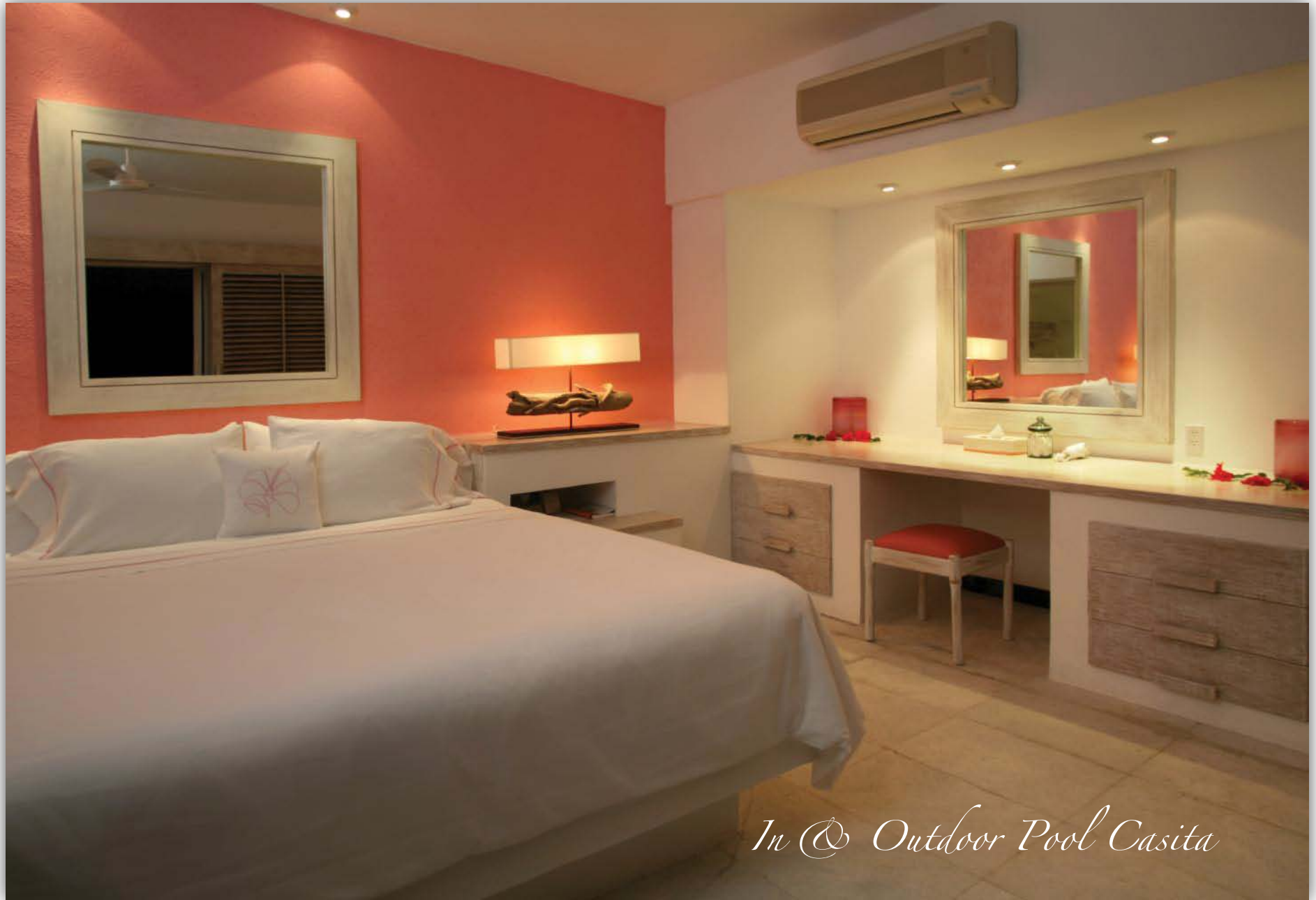
In & Outdoor Pool Casita