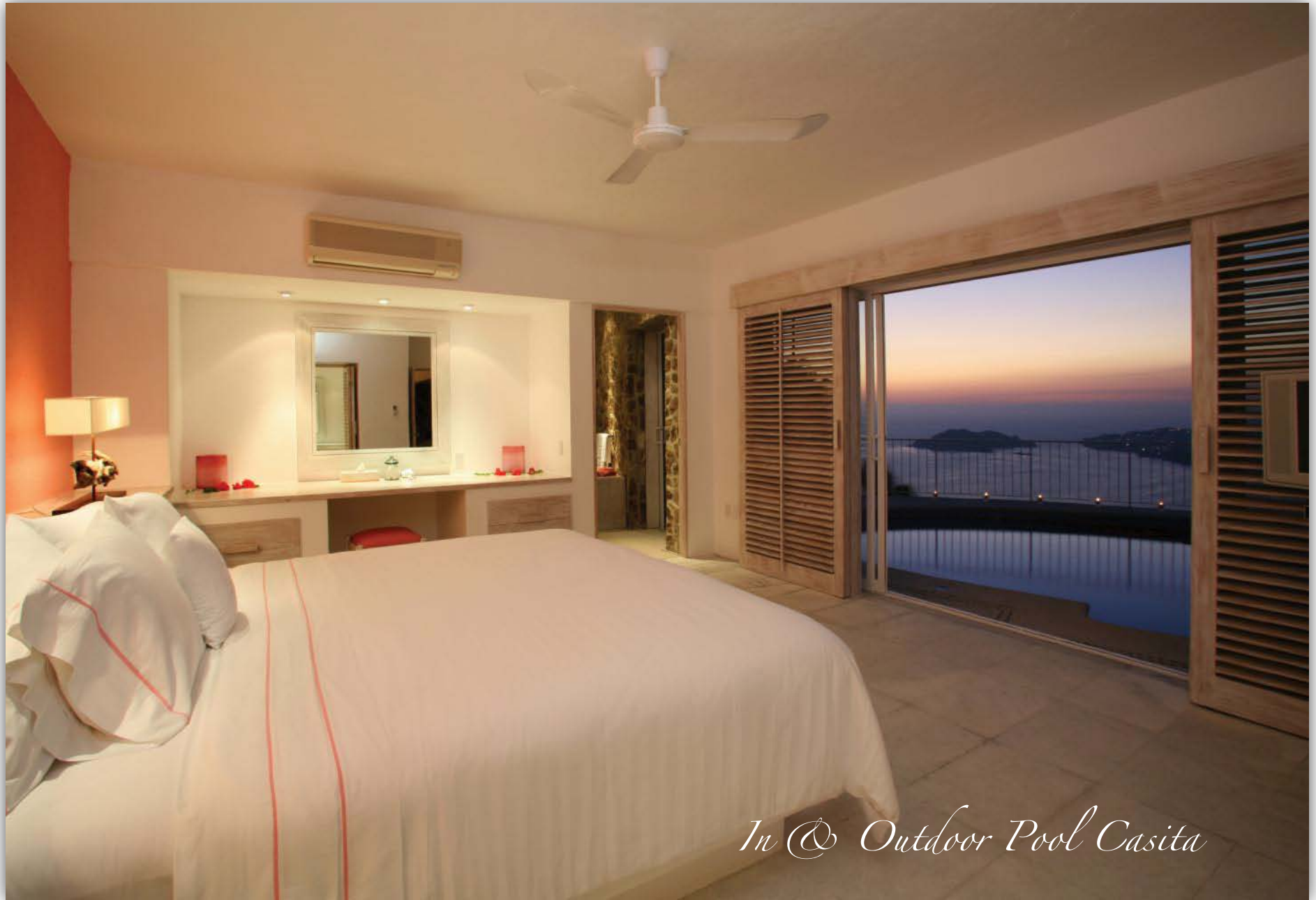
In @ Outdoor Pool Casita