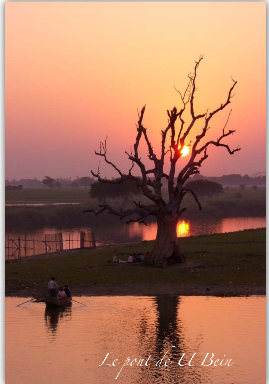
Le pont de U Bein