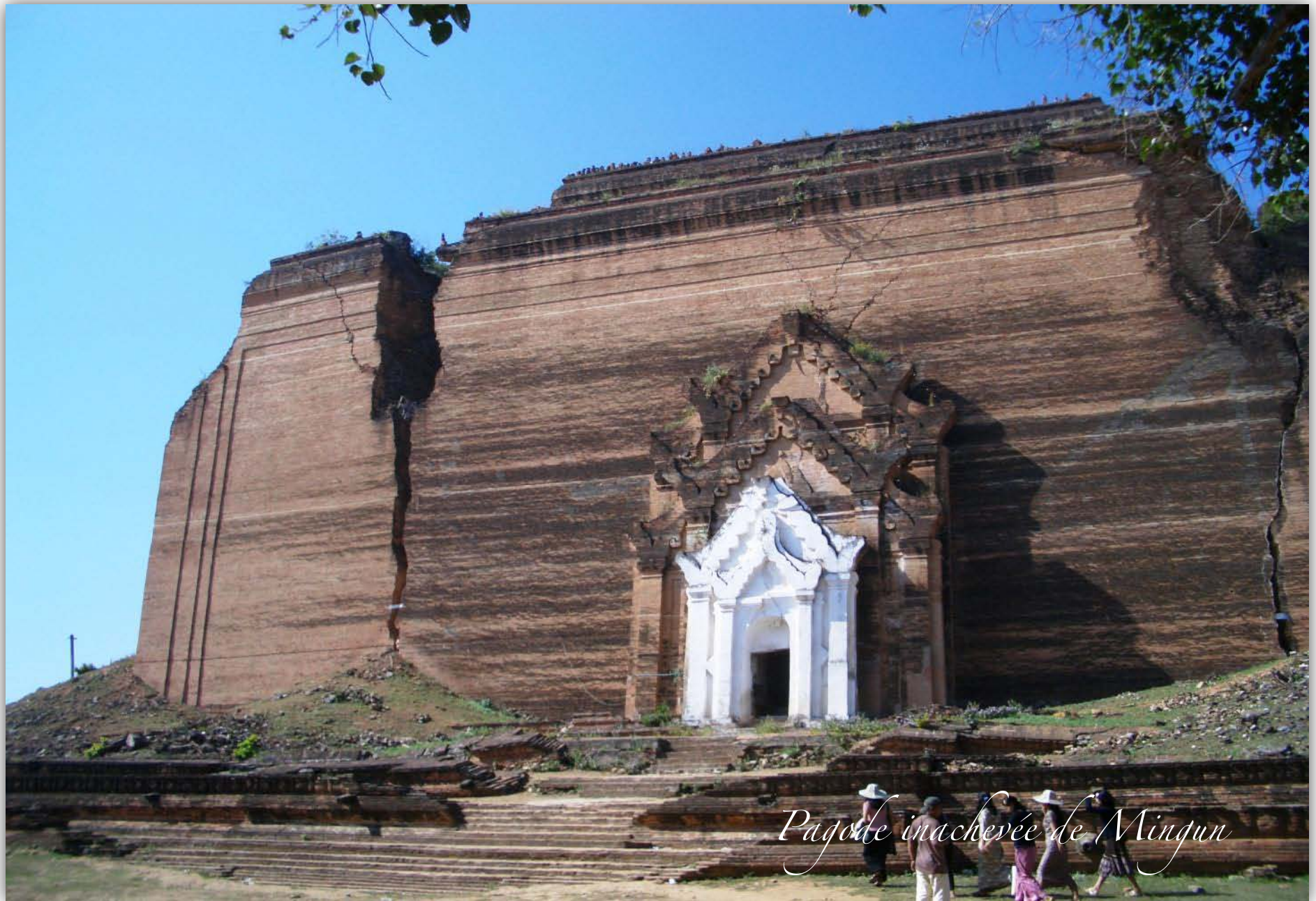
Pagode inachevée de Mingun