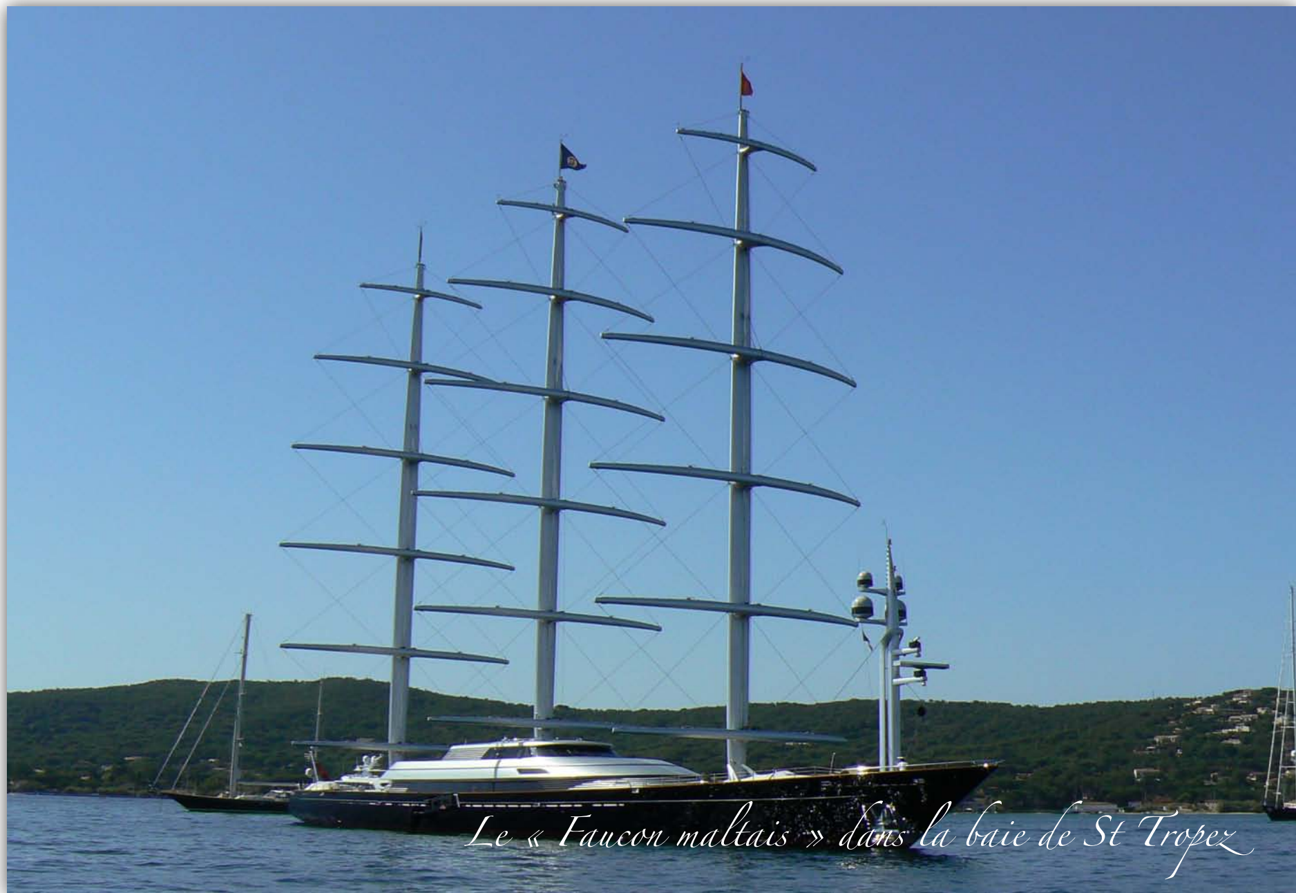
Le « Faucon maltais » dans la baie de St Tropez