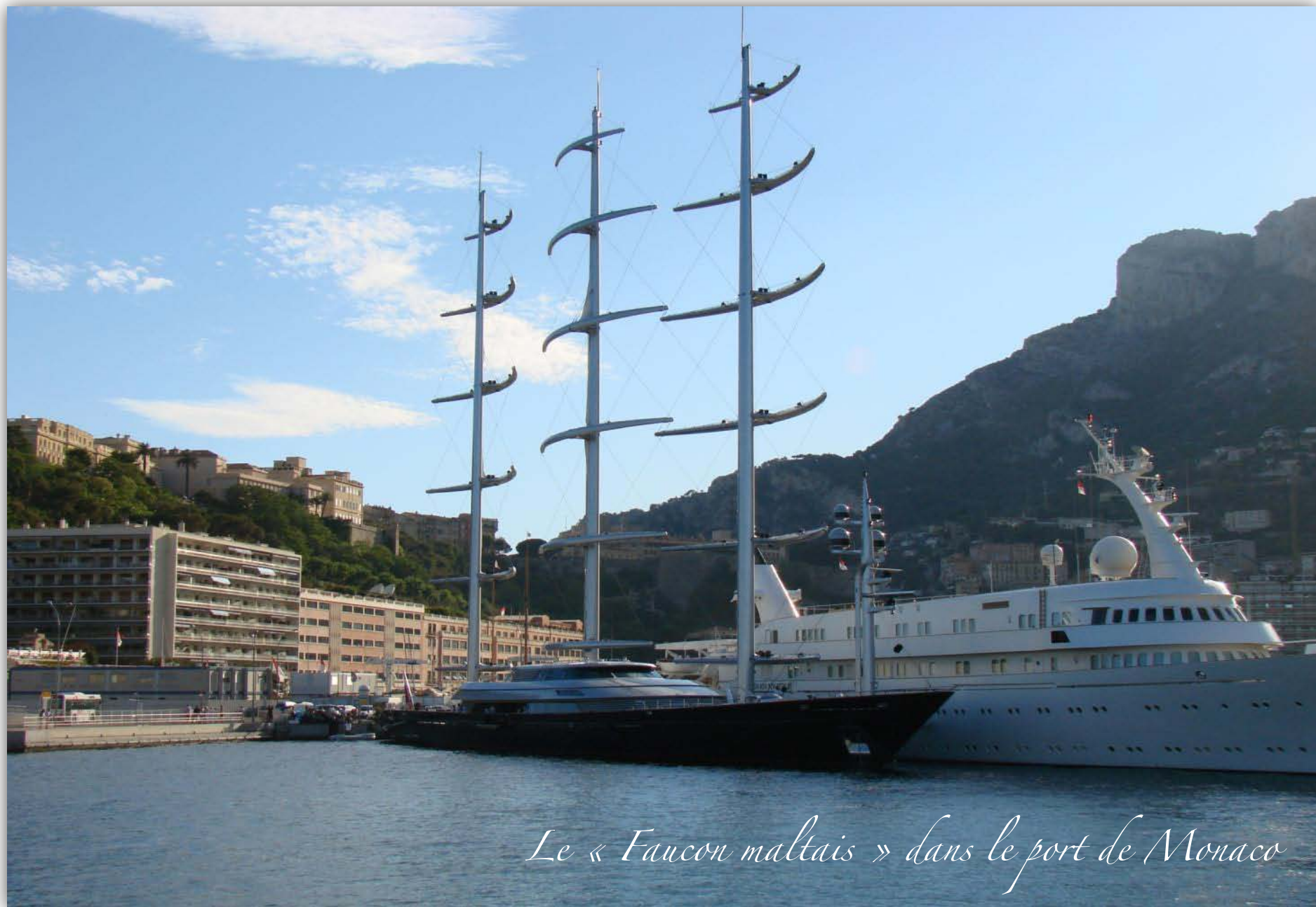
Le « Faucon maltais » dans le port de Monaco