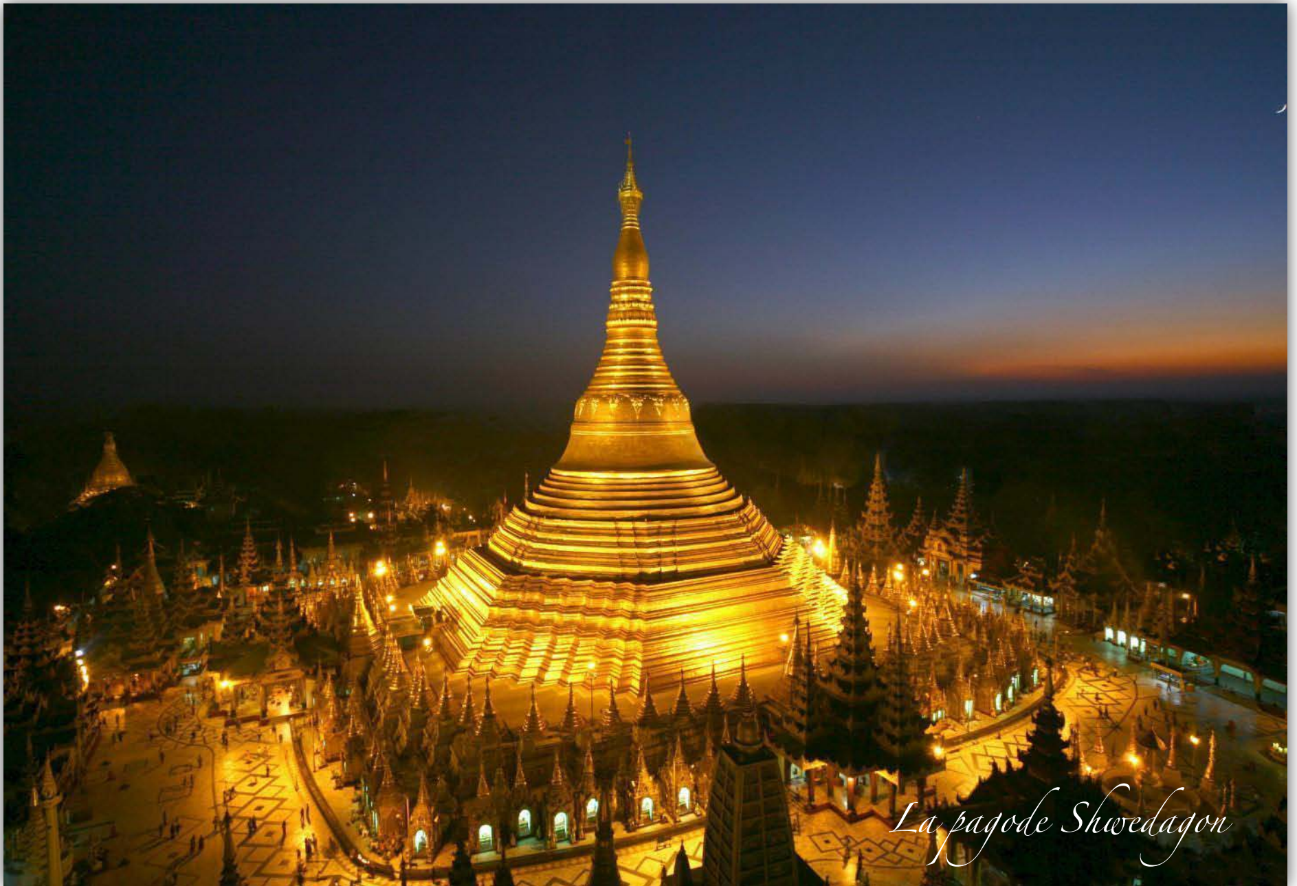
La pagode Shwedagon